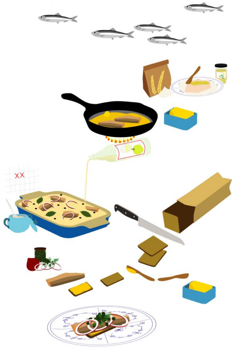
Jesper Aabille: Stegte marinerede sild. Pressefoto