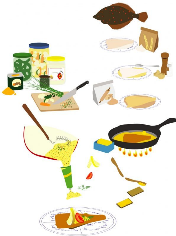
Jesper Abille: Fiskefilet med remoulade.