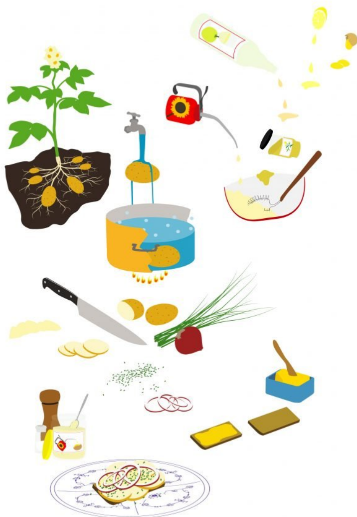
Jesper Aabille: Kartoffelmad. Pressefoto