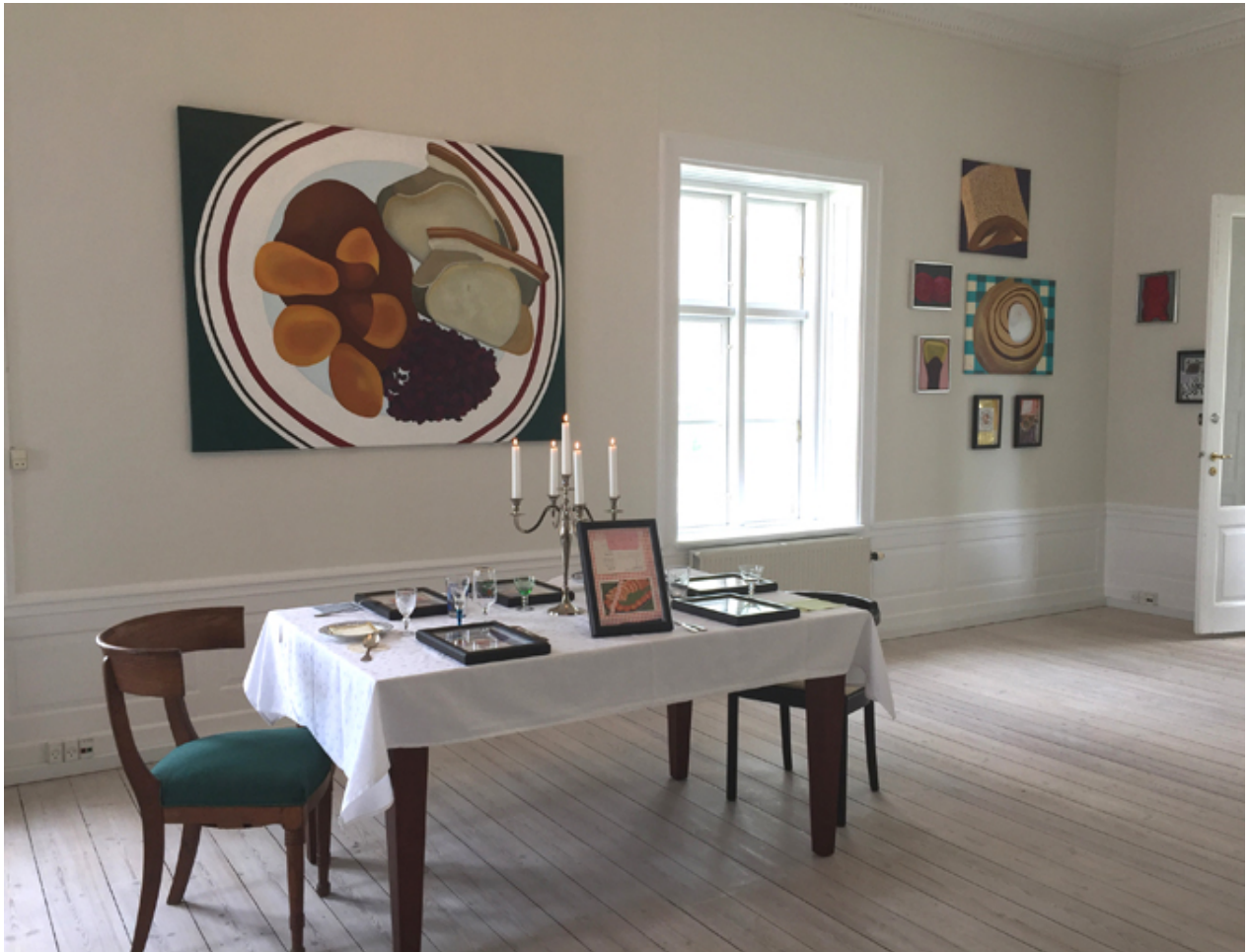
View af TAFFEL med Jonna Pedersen – kunstnerens eget foto.