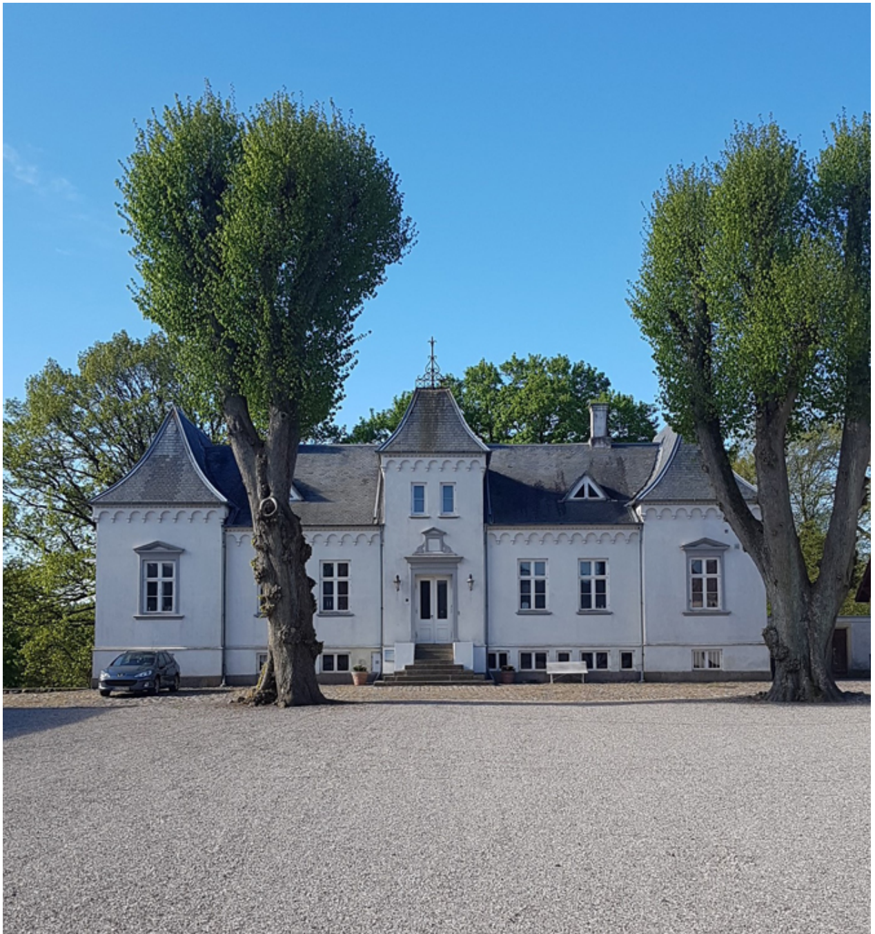
Hessede Hovedgård.