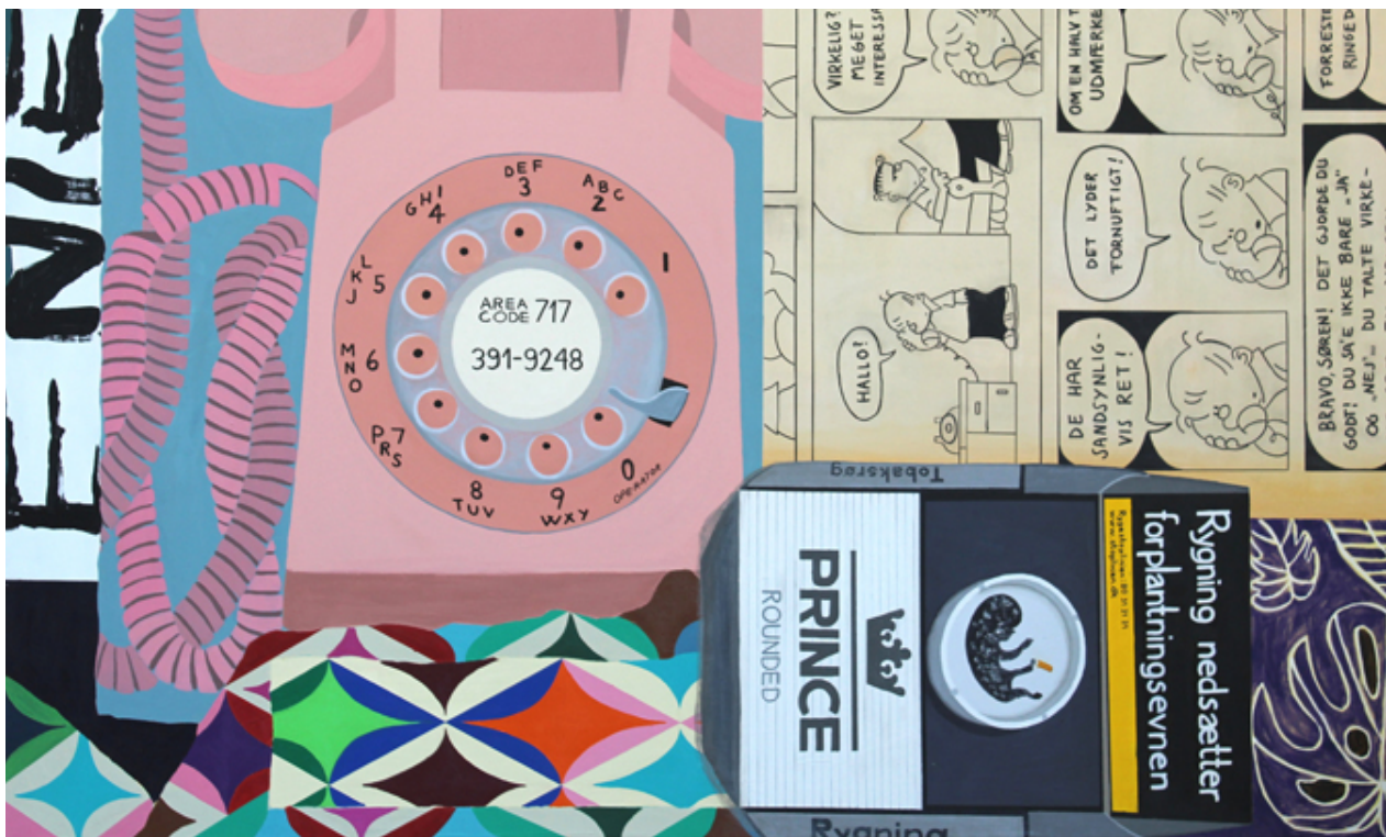
Jonna Pedersen prince melid 134 x 170cm.