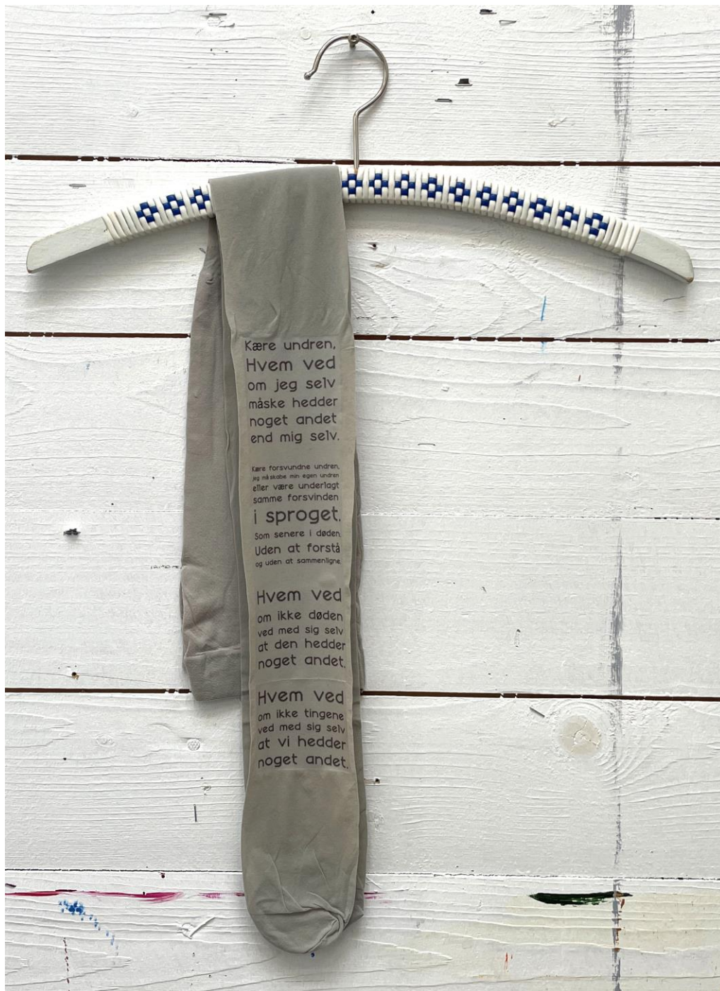
Kære forsvundne undren / installation med bøjle, tryk på nylonstrømpe, uddrag af "Brev i april" / 56 x 43 cm / 2023