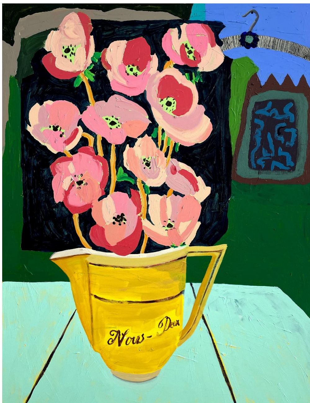
Med buketten på bordet / akryl på lærred / 100 x 80 cm / 2023

der er ned. Det er derfor ikke overraskende, at kunstneren har ladet labyrinten være en del af stilleben malerierne med mælkekander og blomster. Selv i den rolige opstilling kan jeg være retningsforvirret.